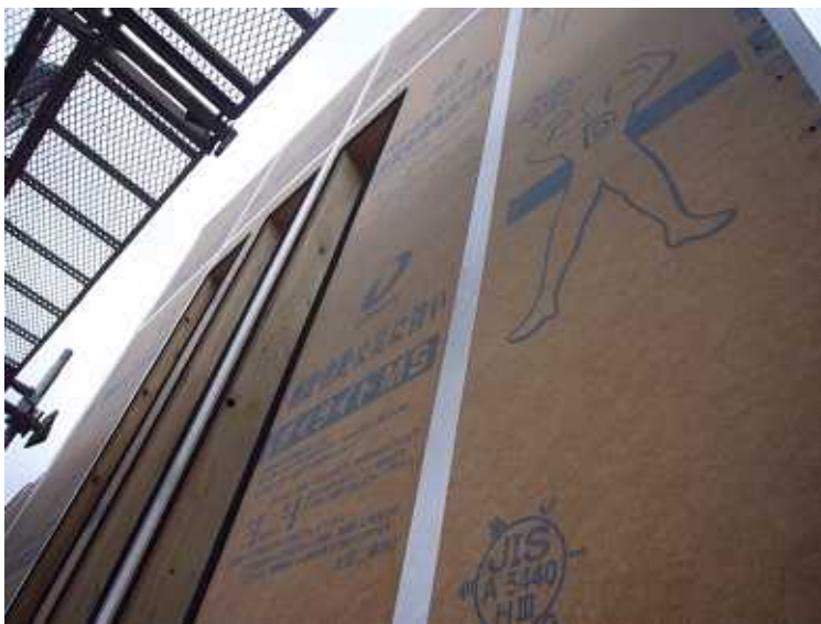
外壁下地には耐震性に優れるダイライト。