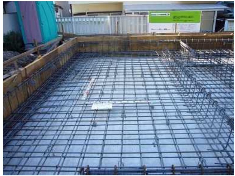
コンクリートを打設しています。