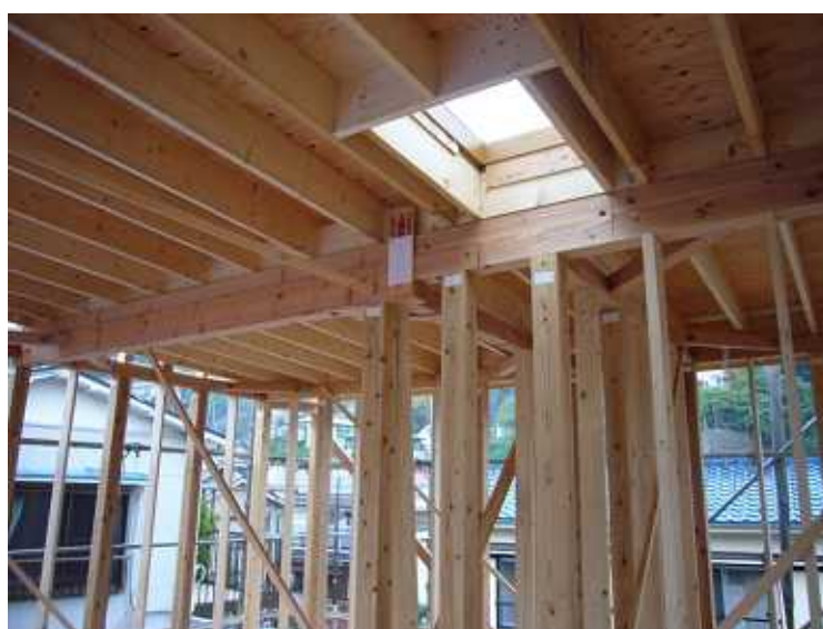
屋根下地です。ほとんど勾配の無い陸屋根です。