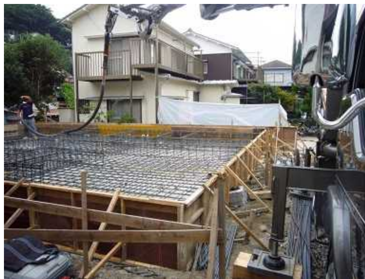
基礎立ち上がりの鉄筋配筋です。