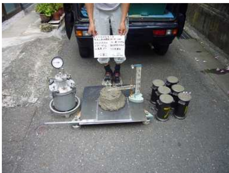
コンクリートのテストピースを取りました。